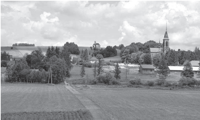
Fot. 2 Wizualizacja lokalizacji kaplicy św. Piotra w Dobrzehowie. Oprac. W. Grodzki