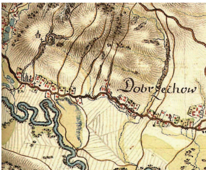
Ryc. 3 Dobrzechów na mapie Friedricha von Miega (oryginał) sporządzonej w latach 1779-1783 (Öster. Kriegsarchiv Karternsamlung, sygn. B IX a 390, F. von Mieg, Karte Konigsreichs Galizien Und Lodomerien, 1779-1783, Col. XII, sectio 87).