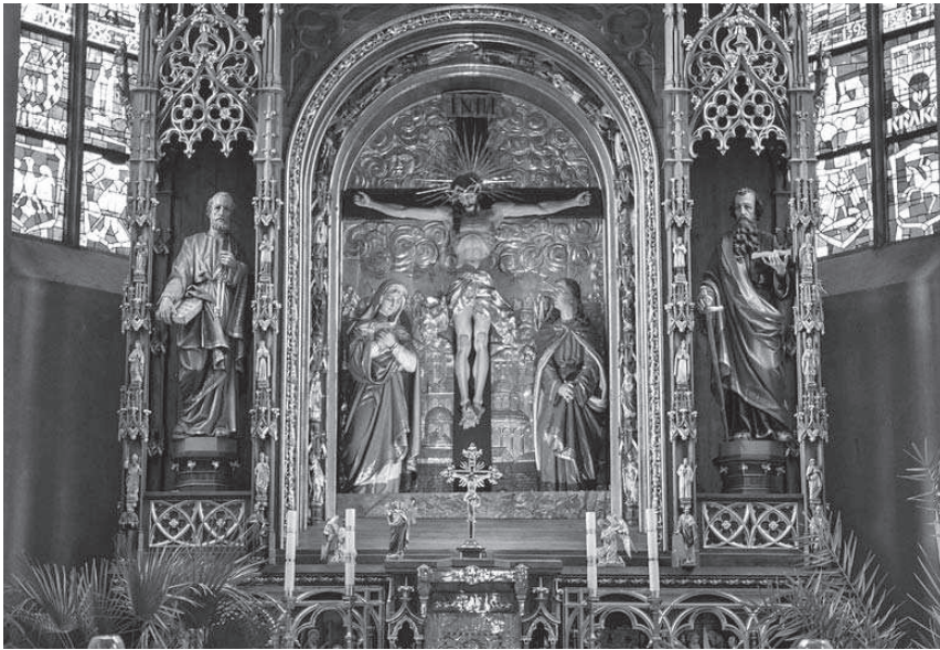
Fot. 1. Ołtarz główny w kościele parafialnym w Dobrzehowie.