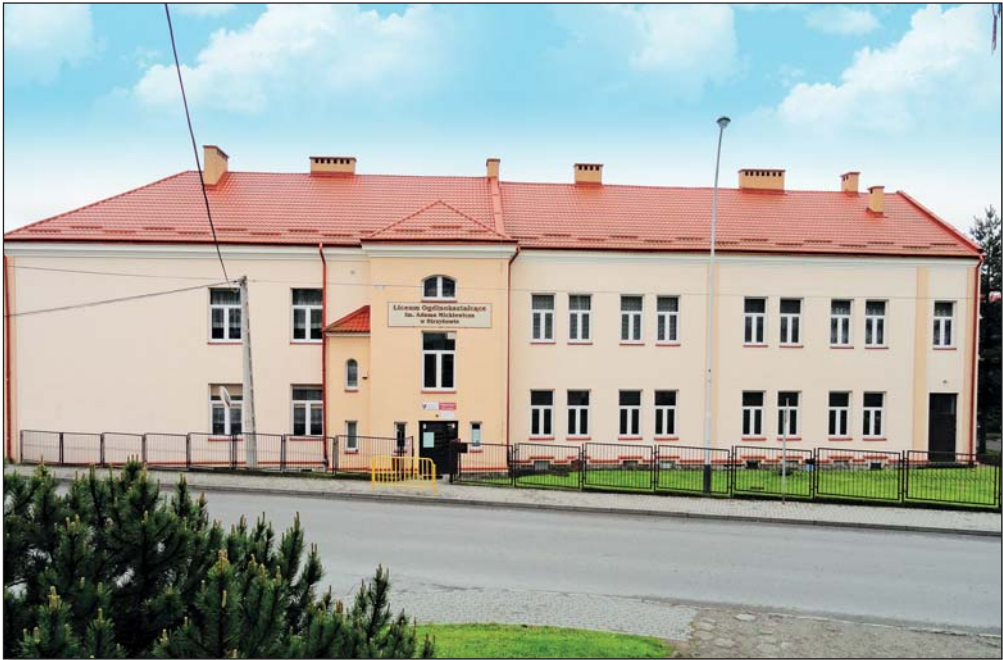
Budynek LO w Strzyżowie, w którym biblioteka mieści się od grudnia 1997 r.