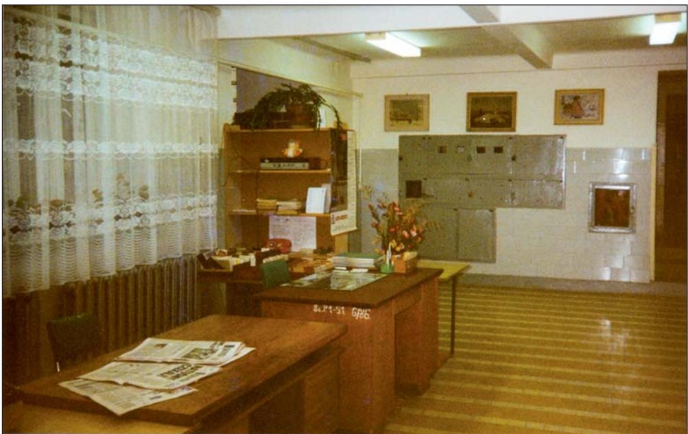
Wypożyczalnia biblioteki po przeprowadzce w 1997 r.