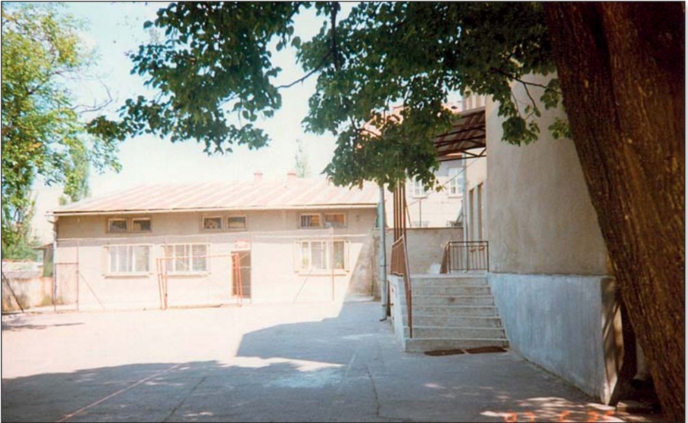
Nieistniejący już budynek przy Szkole Podstawowej nr 1 w Strzyżowie, w którym biblioteka mieściła się w latach 1979-1997.