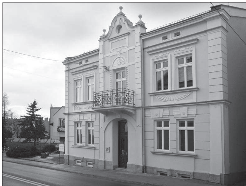
Fot. 1. Fasada frontowa kamienicy przy ul. Łukasiewicza 10 w Strzyżowie (główna siedziba strzyżowskiego muzeum).

nową). Po obu stronach drzwi znajdują się po dwa otwory okienne z nadokiennikami zdobionymi elementami geometrycznymi i kluczem z motywem guza. Boczne partie przyziemia ozdobione są dekoracją pasową, w narożnikach występują zdwojone pilastry. Kondygnacje oddziela dekoracyjny gzyms. Na piętrze budynku w ryzalicie znajduje się balkon, wsparty na kamiennych krosztynach z metalową balustradą. Otwór wejściowy ujęty jest po bokach bogato zdobionym obramieniem z motywem kampanuli, zaś w nadprożu otworu znajduje się stylizowana palmeta. Po bokach usytuowane są po dwa otwory okienne spięte wspólnym gzymsiem nadokiennym i dekoracyjną płyciną podokienną z motywem kwiatu w prostokątnej płycinie. Okna występują w profilowanych opaskach, a nad nimi umieszczony został wspólny poziomy naczółek ze stylizowanym ornamentem łańcuchowym. Na wysokości pietra pilastry obejmujące po bokach elewację zdobione są boniowaniem. Część ryzalitu nad otworem wydzielona została dwoma poziomymi pasami. Centralnie usytuowana jest płycina podcięta półkoliście nad otworem i zaakcentowana na osi kluczem z ornamentem łuskowym. W półkolu pojawia się palmeta z centralnym siedmiopłatkowym kwiatem. W zwieńczeniu ryzalitu znajduje