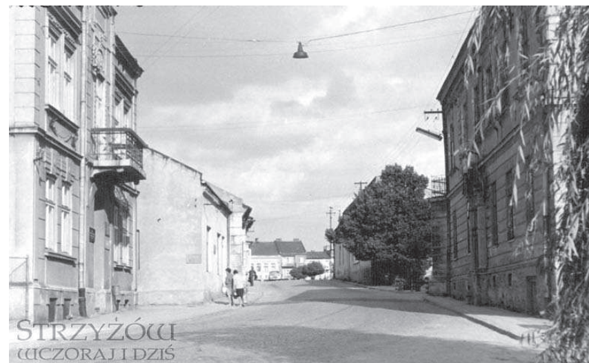
Fot. 3. Widok od strony zachodniej na ulicę Sobieskiego. Po lewej stronie widoczna jest fasada opisywanej kamienicy.

Mieszkania zajmowane przez osoby fizyczne znajdowały się na każdej kondygnacji budynku. Do mieszkania na strychu wchodziło się po drewnianych schodach. Pomieszczenie na parterze, w części oficynowej, było ciemne i wilgotne. Na piętrze wychodziło się również na balkon, gdzie były wejścia do mieszkań prywatnych. Po rozwiązaniu PKPS, pod schodami na parterze, PCK uruchomiło pierwszy w Strzyżowie sklep z odzieżą używaną. Po przenosinach MGOPS do budynku przy ulicy Słowackiego, na parterze ulokowano Punkt Konsultacyjny ds. Uzależnień, przeniesiony z parterowego budynku przy ulicy Parkowej, który rozebrano. Natomiast pomieszczenia na piętrze wyremontowano i utworzono w nich mieszkania dla ofiar powodzi