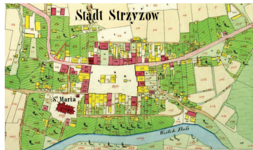
Ryc. 3. Fragment planu katastralnego miasta Strzyżów z 1851 r. Archiwum Państwowe w Rzeszowie, Stadt Strzyżów sammt Ortschaft Przedmieście in Galizien, zesp. 1313, sygn. 2277, sekcja nr V. Budynki zaznaczone kolorem różowym to obiekty murowane, żółtym - drewniane. Kolorem czerwonym zaznaczono obrys działki nr 61.