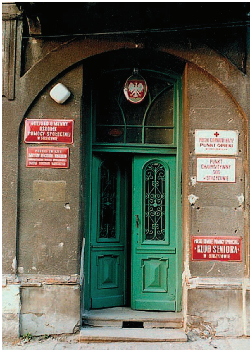
Fot. 2. Główne wejście do budynku od strony ul. Łukasiewicza. Lata 90. XX wieku.

Krzyż, który przeniósł się potem do budynku przy ulicy Daszyńskiego (obecnie budynek Urzędu Skarbowego). Po tym jak PKPS w Strzyżowie został rozwiązany, MGOPS otrzymał do dyspozycji parter kamienicy. W pobliżu schodów znajdowała się kasa, po prawej i lewej stronie od wejścia głównego - pomieszczenia dla pracowników socjalnych. W drugim pokoju po lewej była księgowość, nieco dalej gabinet kierownika ośrodka. Do MGOPS należały również pomieszczenia w piwnicach. Tam składowano węgiel i drzewo na opał, a pracownicy palili w piecach kaflowych. Gdy z mieszkań na piętrze wyprowadzili się mieszkańcy, lokale te zaadaptowano na potrzeby MGOPS. W pomieszczeniach z balkonem znajdowało się archiwum oraz stanowisko pracy informatyka.