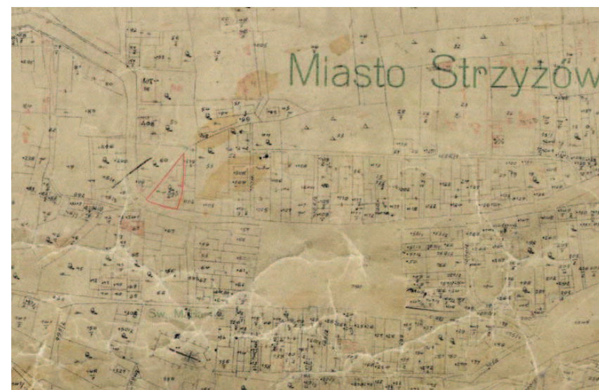
Ryc. 4. Fragment planu Strzyżowa z 1910 r. Archiwum Powiatowego Ośrodka Dokumentacji Geodezyjnej i Kartograficznej w Strzyżowie.